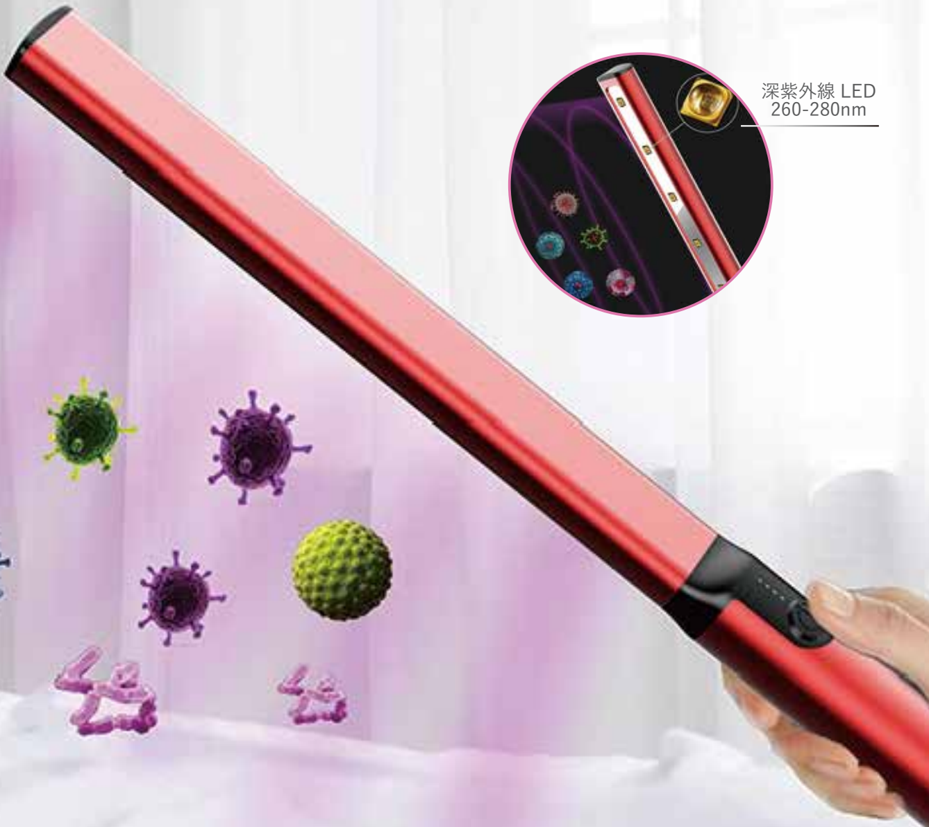
深紫外線 LED 260-280nm