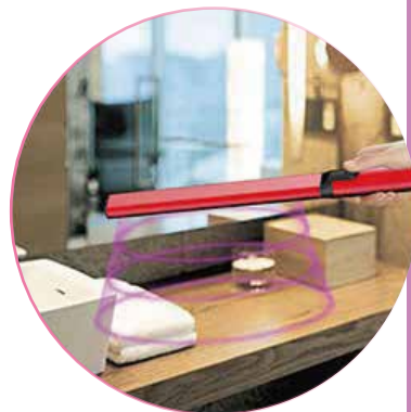
旅行 / 出張先